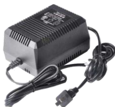
TEAC-66-243000V (EU) МКАС-66-243000U (USA) TEAC-66-243000VB (UK) Блок питания (модель для установки снаружи помещений)